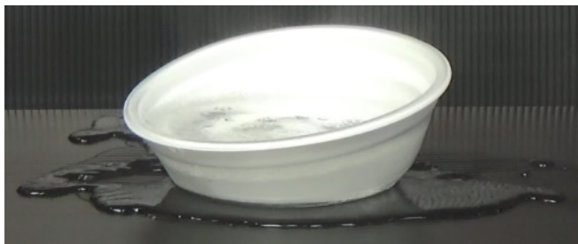
発泡ポリスチレン製容器が破損し、湯が漏れ出した様子